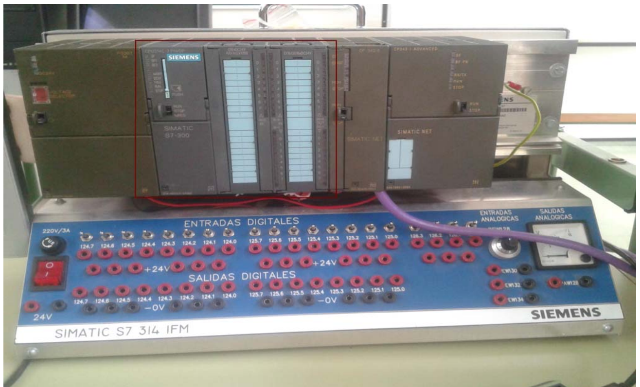
Figura 1. PLC S7-314C-2PNDP

En paralelo, se han adquirido 10 licencias del software TIA PORTAL v12, del que se muestra una